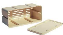
POSTAZIONE PER USO INTERNO

Il sistema Exterra™ utilizza diverse stazioni di monitoraggio che permettono di adattarsi a tutte le situazioni: interni, suolo naturale (terreno), cemento, strutture in muratura etc. Tutti gli erogatori utilizzati dal sistema Exterra™ sono facilmente installabili e adattabili all'ambiente e permettono un'intercettazione/adescamento.