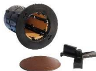
POSTAZIONE PER SUOLO NATURALE