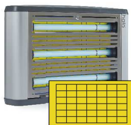
HALO 45W Aqua IP45